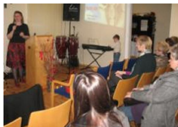
Sluchaczki z zainteresowaniem słuchały wykładu.

Dużym zainteresowaniem kobiet spotkało się Kameralne spotkanie "Pokochaj siebie", które odbyło się w Ustce. Były rozmowy z psychologiem, kawa i ciasto, a także upominki.